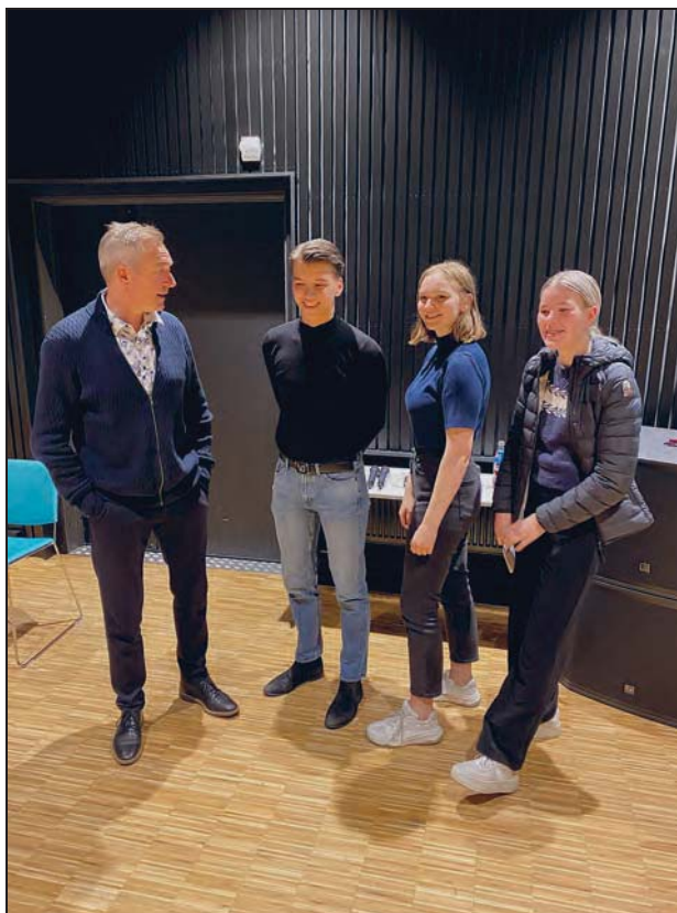
Figur 1.4 Det har funnet sted en rekke samtaler med medlemmer av ungdomspanelet i arbeidet med nordrådemeldingen. Bildet viser forsvarsminister Frank Bakke-Jensen i samtale med ungdommer i Kirkenes.