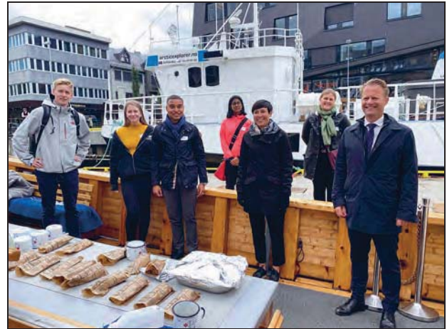
Figur 1.20 Ungdomspanelet har i sine anbefalinger trukket fram viktigheten av at unge involveres i internasjonalt samarbeid. Her møter utenriksminister Ine Eriksen Søreide og Danmarks utenriksminister Jeppe Kofod medlemmer av ungdomspanelet i Tromsø 14. august.