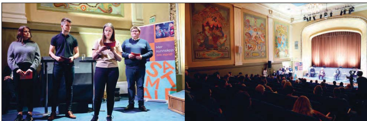
Figur 1.5 Ungdomspanelet arrangerte folkemøte i Tromsø 19. september med statsminister Erna Solberg, utenriksminister Ine Eriksen Søreide, barne og familieminister Kjell Ingolf Ropstad og daværende Venstreleder Trine Skei Grande.

De større byene har også et ansvar for å invitere ungdom fra distriktene når ting skjer. Are-