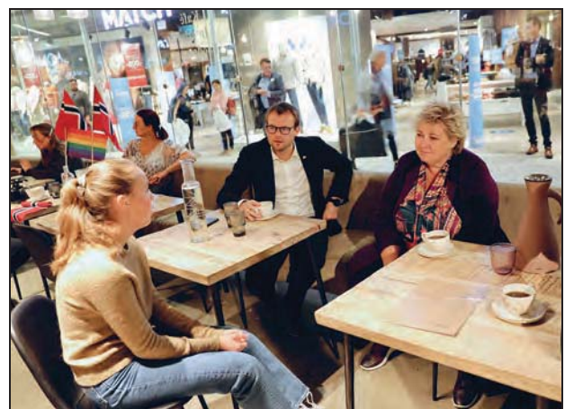
Figur 1.9 Ungdommer ønsker å bli involvert når regjeringsmedlemmer har møter i nord. Statsminister Erna Solberg og barne- og familieminister Kjell Ingolf Ropstad i samtale med unge på kafé i Tromsø 19. september.