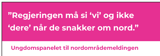
Figur 1.15 Illustrasjon: Reibo AS.

Myndighetene og media må tenke på hvordan Nord-Norge fremstilles. Bildet som legges frem, er ofte et som vi ikke kjenner oss igjen i. Det bør jobbes for å endre negative bilder og stereotyper.