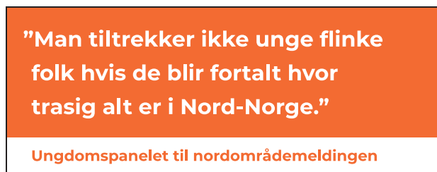
Figur 1.14 Illustrasjon: Reibo AS.

en situasjon der de henger på sentre eller andre steder til de blir jaget. Aktivitet bør tilbys, slik at unge ikke havner i usunne miljøer der rusmisbruk er en del av hverdagen. Oppfølging fra våkne voksne er viktig. Det må også finnes tjenester for de som ikke har det bra, slik som utekontakt og lavterskelteam. For eksempel utekontakten i Tromsø, som tilbyr aktiviteter som klatring og matservering, men mest av alt er tilgjengelig hele tiden. Der kan mange få den hjelpen og tryggheten man ikke får hjemme, de har faktisk reddet mange ungdommer.